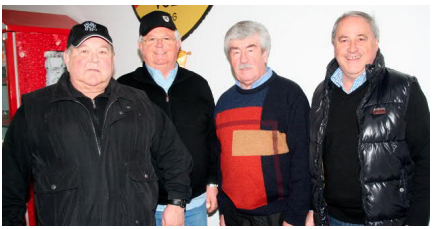
Die Ulmenstr. landete auf Platz 2