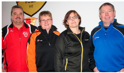
Der Kreisverkehr erreichte Platz 3