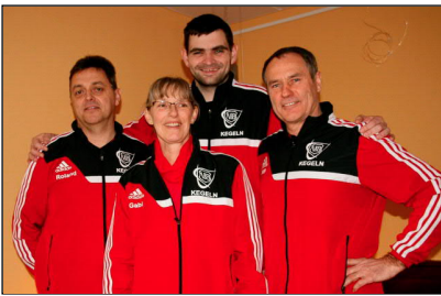
Die 4 Kegelfreunde