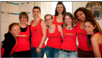
Sympathische Verliererinnen auf den beiden letzten Rängen