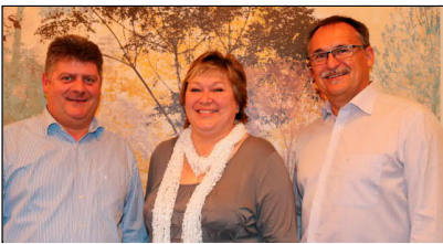
Vorstand bei Ehrungen