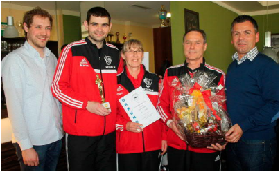
1. Platz 4 Kegelfreunde