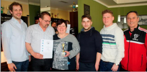
2. Platz Sumpfköpfe