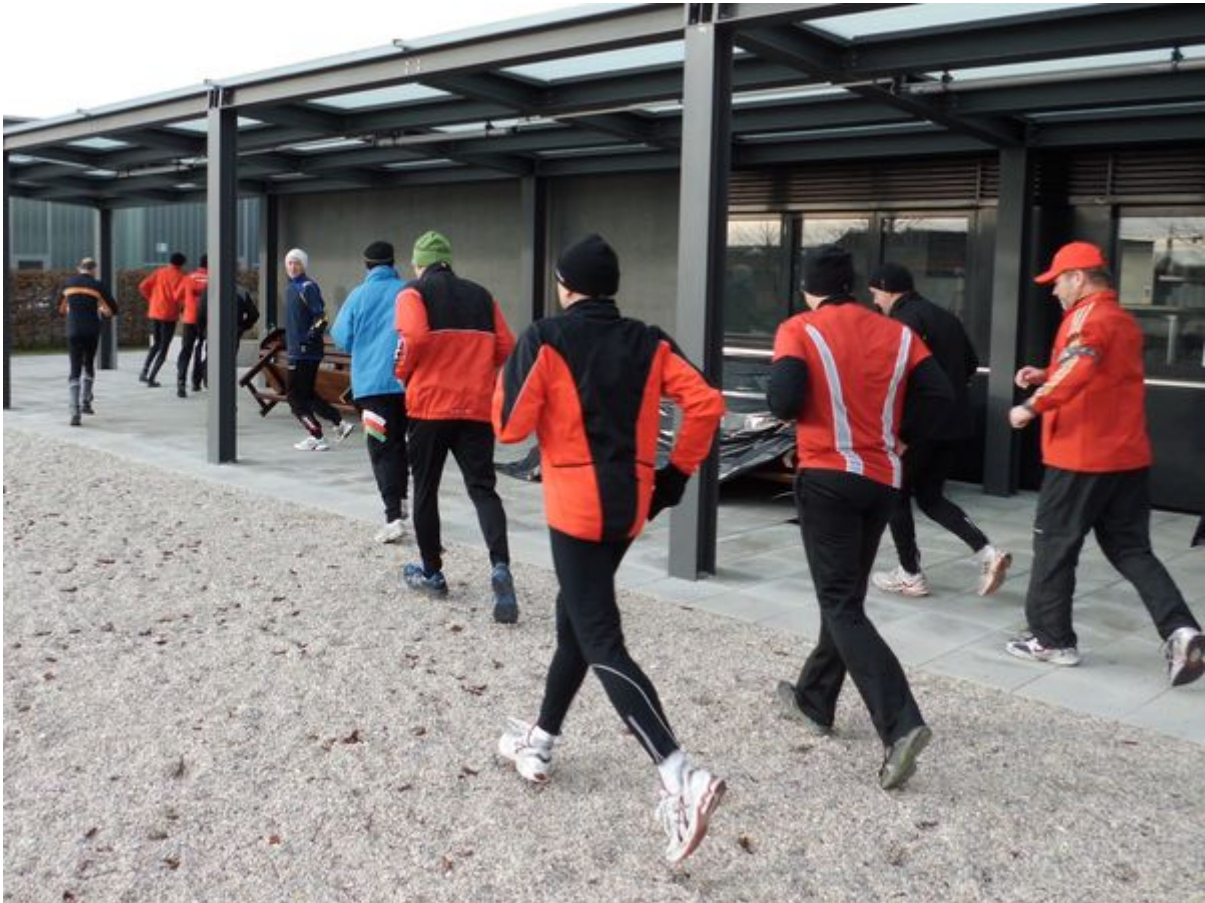
(hh, Bild gratis)