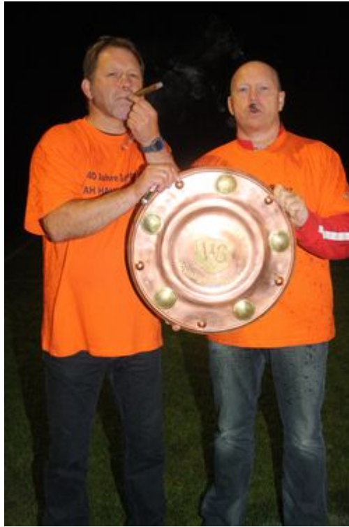
Als Belohnung für den Stress gab es für die „Meistertrainer“ je ein „Fat-Lady-Zigarre zum Rauchen