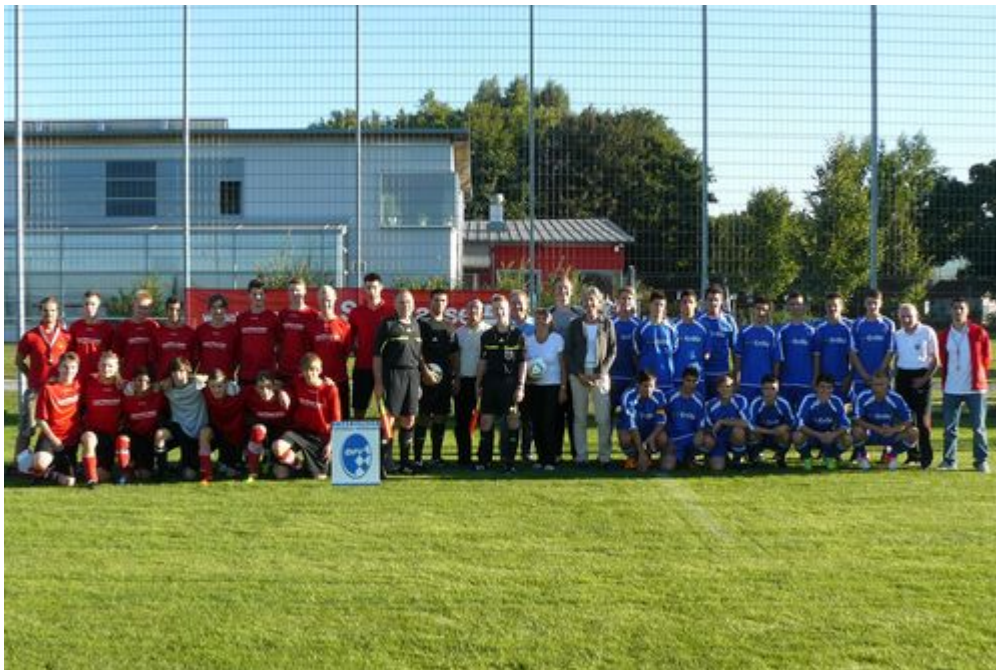
Auftakt des Sparkassencups mit den Teams vom VfB und Neufahrn und Vertretern von der Sparkasse und Vereinen

U15-C-Jugend 11.9. gegen Allershausen U13-D-Jugend 12.9. gegen Zolling U11-E-Jugend Termin nicht im Internet U9-F-Jugend 14.9. gegen Marzling