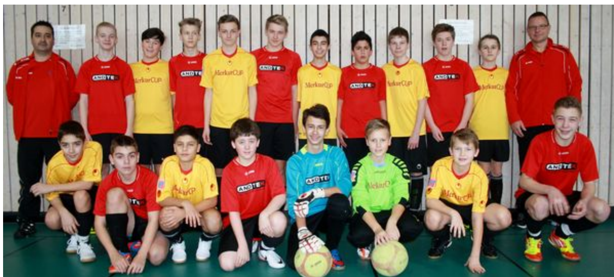
Zwei Mannschaften beim C1-Turnier

Am Sonntag 17. Februar startete das dritte VfB Team der C-Jugendlichen ins Turnier. In einem gut besetzten Turnier erreichten sie den sechsten Platz. Als Sieger des Turniers ging die Spielvereinigung Hebertshausen vom Feld, gefolgt von dem TSV Haar und dem FC Mintraching.