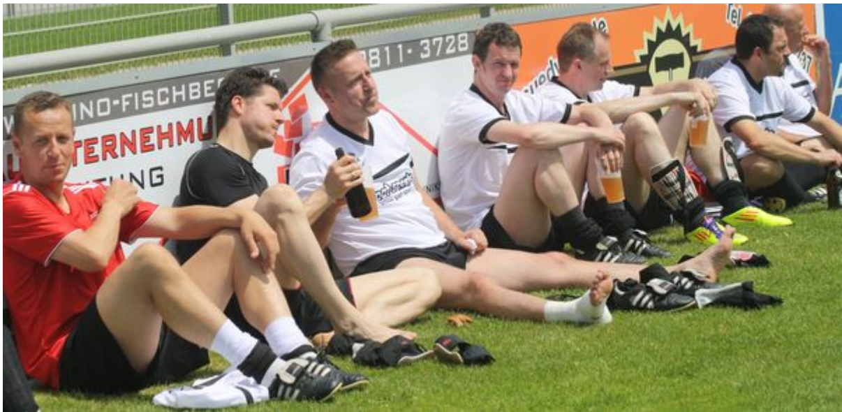
Geschafft nach dem nervenaufreibenden Siebenmeterschießen, das mit 5:4 an Kranzberg ging, schauten die Allershausener sich das Endspiel entspannt sitzende von der Bande aus an