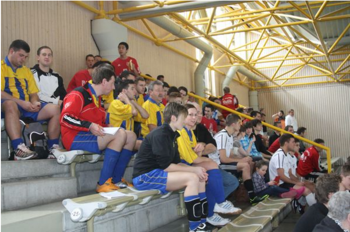
Gute Stimmung herrschte auf der Tribüne

Ein besonderer Dank der AH-Leitung geht an alle Helfer vor und hinter der Theke, beim Reinigen, Backen, Organisieren und beim Aufräumen, sowie den Schiedsrichtern.