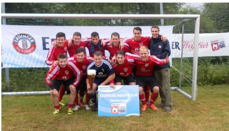
Sieger in Oberbayern: VfB Hallbergmoos