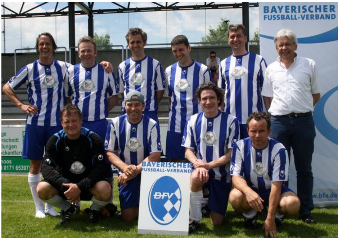
Der Zweitplatzierte TSV Brannenburg

(Text Hans Hartshauser /Christiane Oldenburg-Balden Bilder)