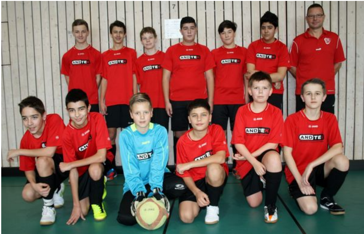
Mannschaft beim C2-Turnier