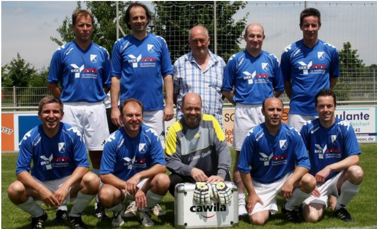
Die Drittplatzierten : Der SV Kranzberg