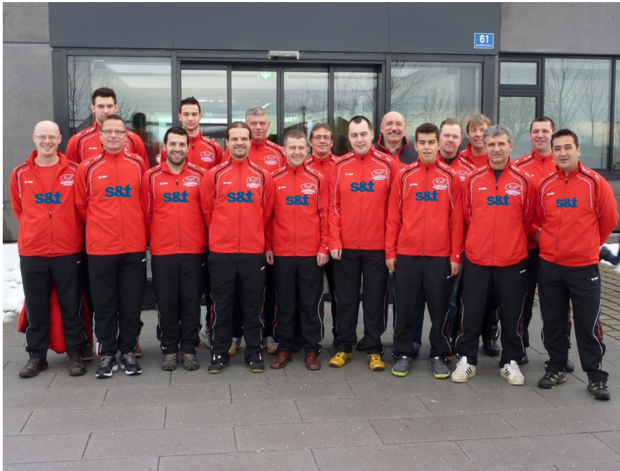
Die Trainer Abteilung Fußballjugend