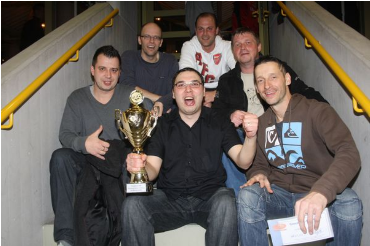
Riesig freuten sich die Truderinger die lange keinen Turniersieg mehr verbuchen konnten