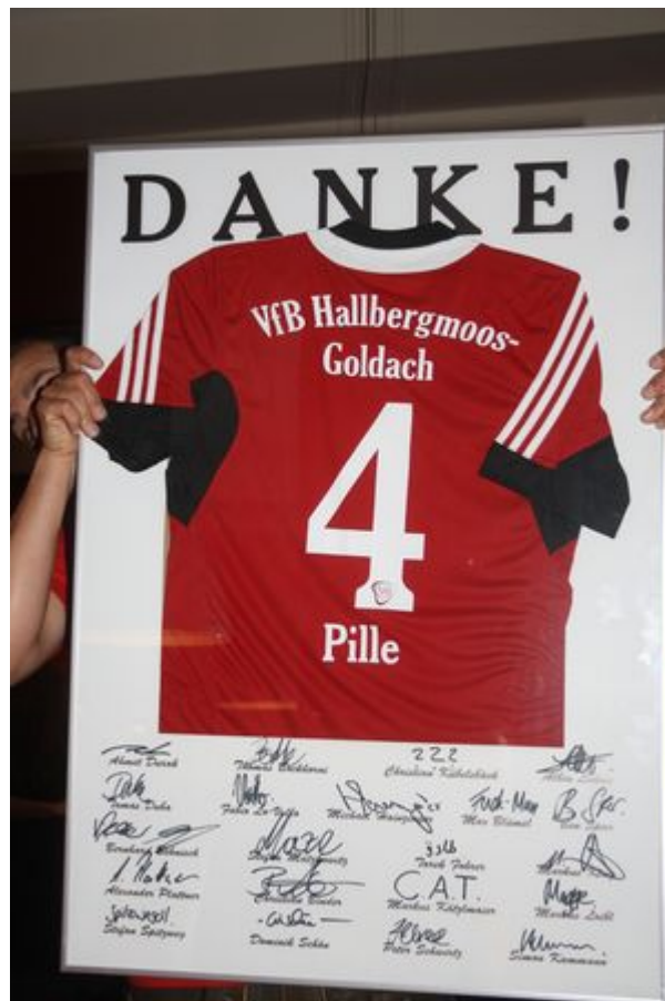
Ein Fußballtrikot mit den Unterschriften der Spieler gab es zum Abschied für "Pille"