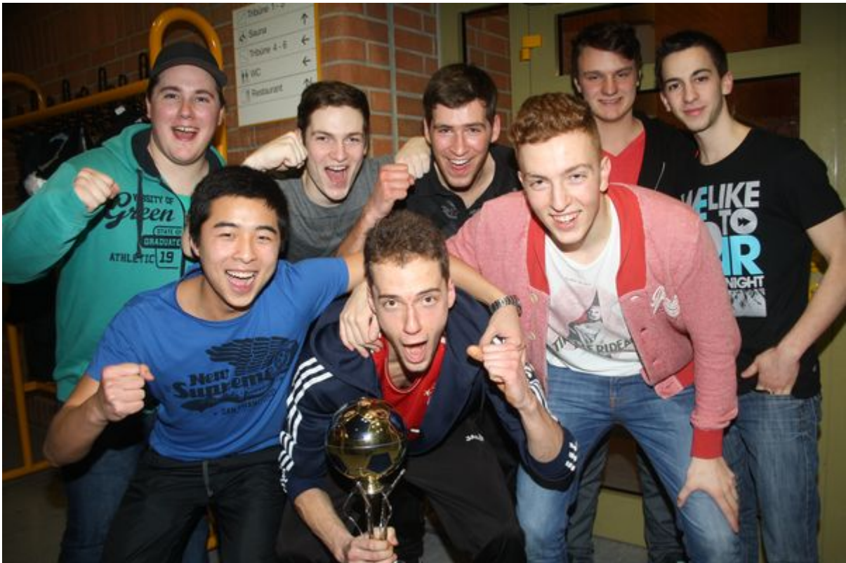
Die Sieger bei den Hobbykickern das Team Paxi Fixi