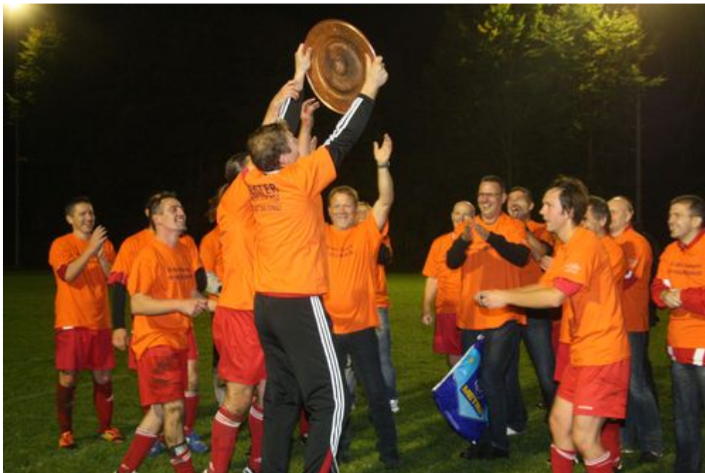
Die Meisterschale wurde immer wieder rumgereicht