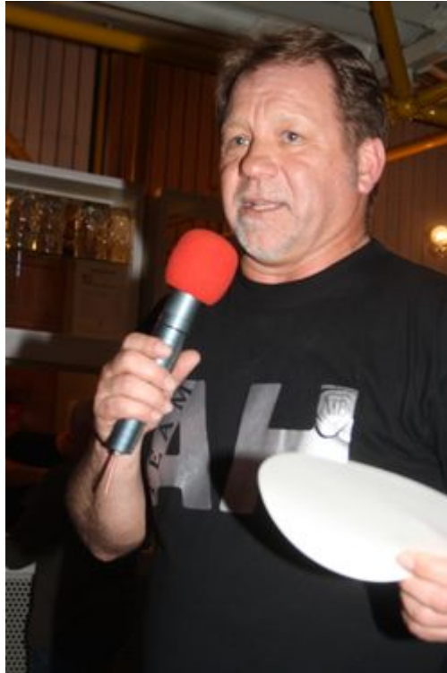
Der Chef und sein Team hatten das Turnier organisiert