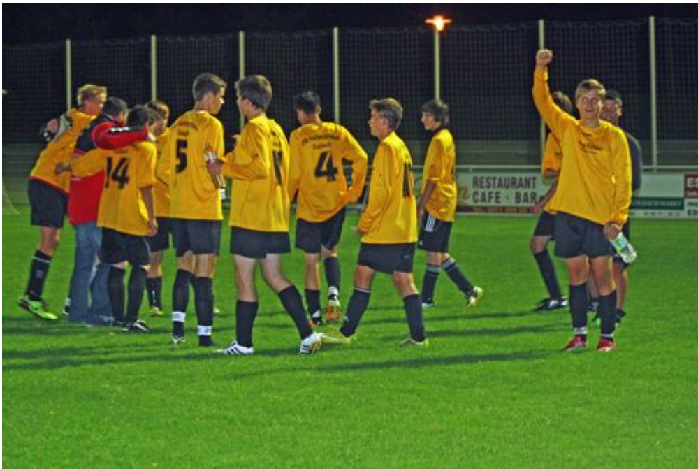
(Text und Bild: Christiane Oldenburg-Balden)