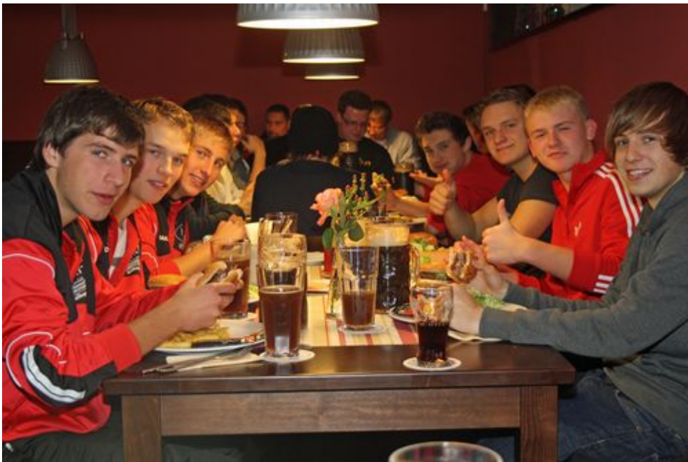
(Text und Bild: Christiane Oldenburg-Balden)