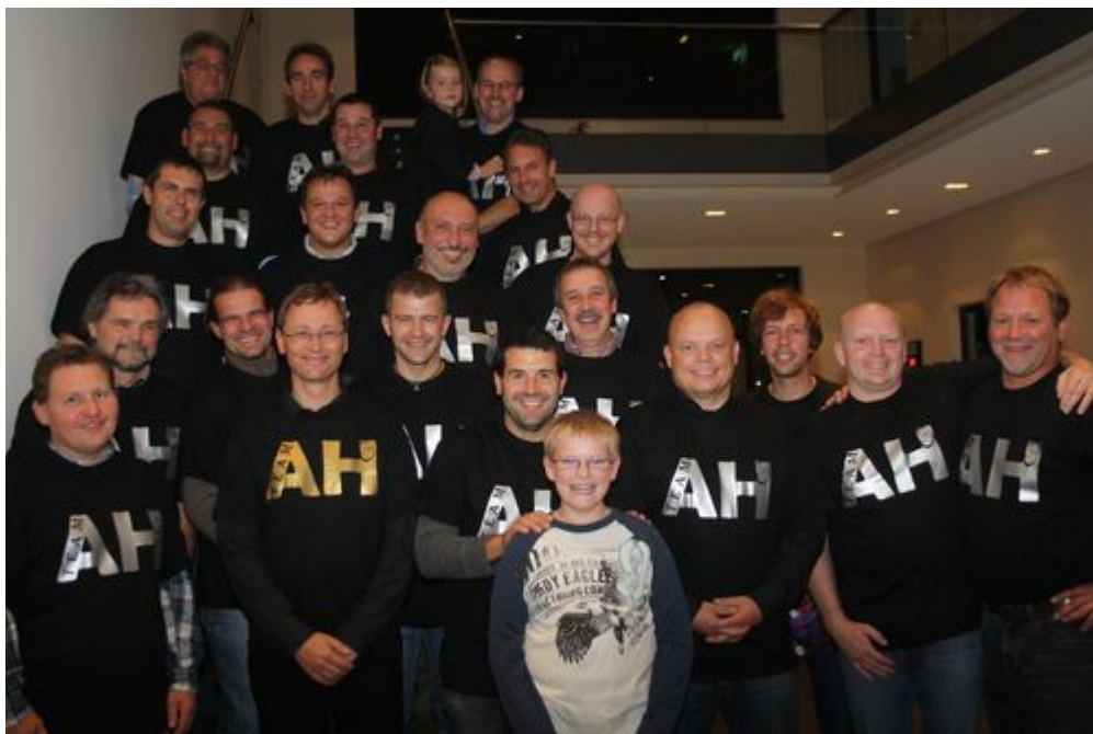
Ausgestattet mit neuen T-Shirts präsentierten sich die AH-Spieler