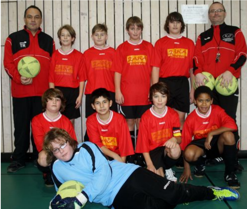
D2-Junioren VfB Hallbergmoos-Goldach