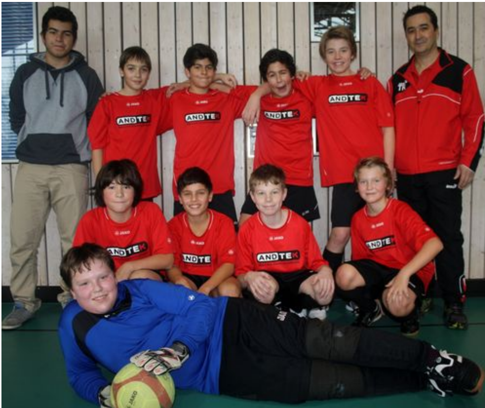
D1-Junioren VfB Hallbergmoos-Goldach