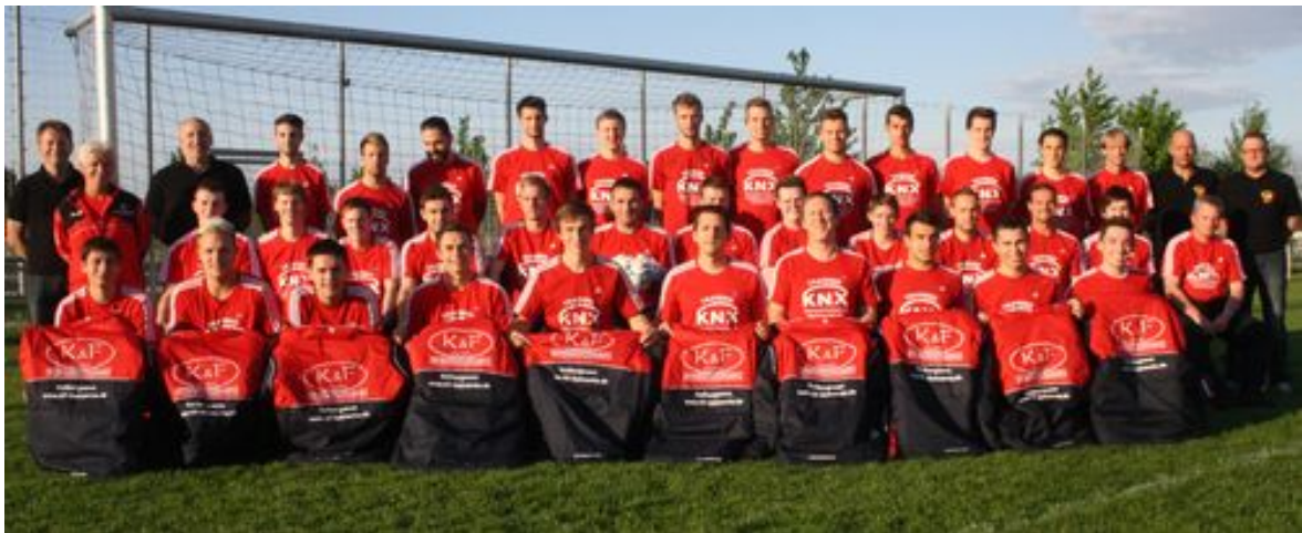
Die Spieler mit der neuen Ausstattung