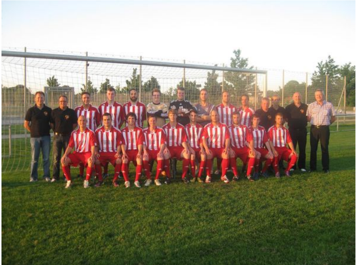
Die zweite Mannschaft mit den neuen Trikots