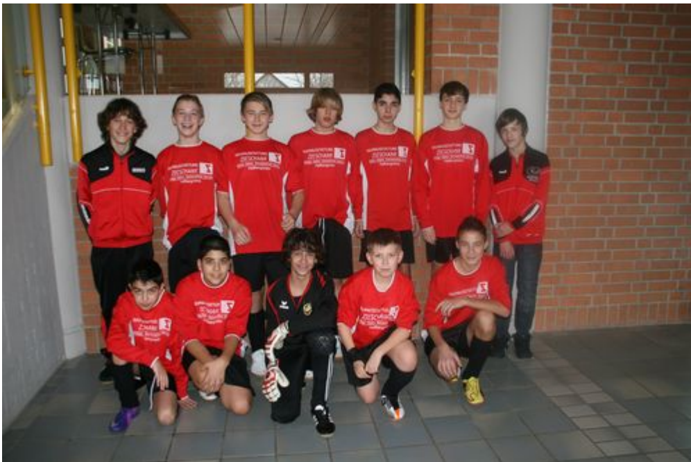
Die C-Jugend des VfB Hallbergmoos

Die weiteren Turniere sind: 28.1. D-Junioren, 29.1. D2-Junioren, 4.2. F1- Junioren, 4.2. F3- Junioren (16.15 Uhr), 5.2. F2-Junioren, 5.2. E-Juniorinnen (16.30 Uhr), 11.2. E2-Junioren) und 12.2. E1-Junioren. Alle Turniere beginnen um 10.00 Uhr in der Dreifachturnhalle mit Ausnahme der F3 und der E-Juniorinnen.