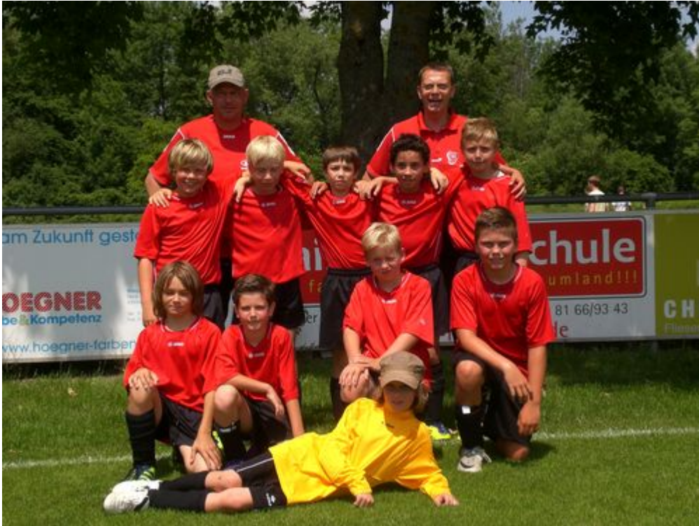
E1 die in Allershausen angetreten ist