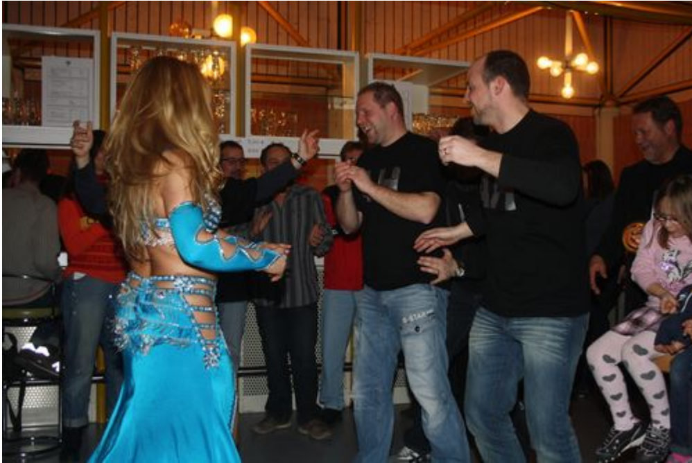
Im inoffiziellen Teil sorgte die attraktive Bauchtänzerin für Stimmung