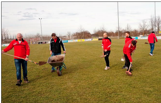
auch ein Teil der ersten Mannschaft war vertreten