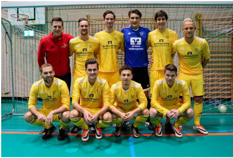
VFB 1 siegte beim eigenen Turnier