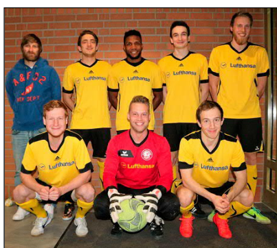
Freising wurde überraschend letzter