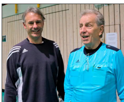
die Schiedsrichter leiteten routiniert die Spiele