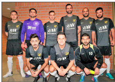
Mintraching belegte den dritten Platz