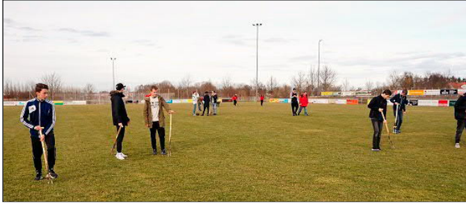
Die U17 voll im Einsatz