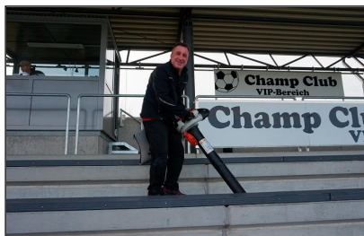
Der Sigi mit seinem neuen Spielgerät