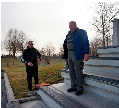
Die Tribünensitze wurden abgewaschen