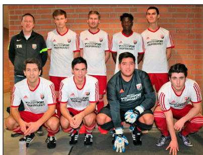
Neufahrn wurde siebter