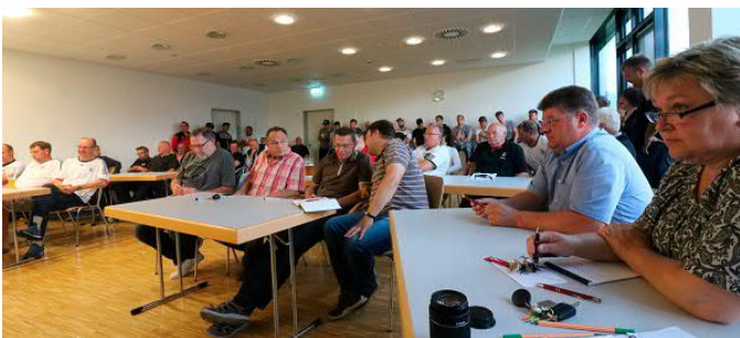
Am Ende waren rund 60 Mitglieder zur Sitzung erschienen