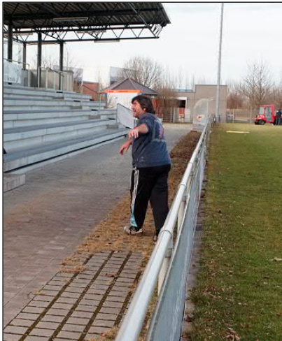
Der Platzwart war begeistert