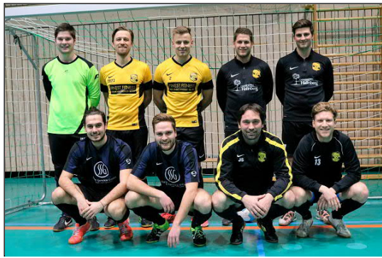
Moosinning konnte den Titel nicht verteidigen und landete auf Rang 5