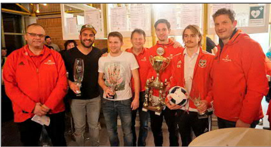
Die drei Erstplatzierten