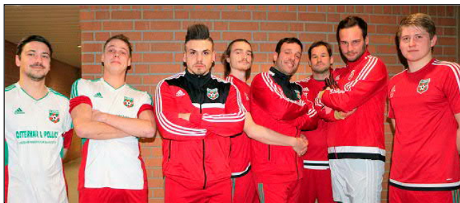
Schwaig wurde Zweiter