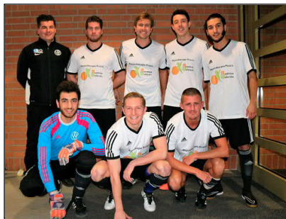
Feldmoching belegte am Ende Rang 6