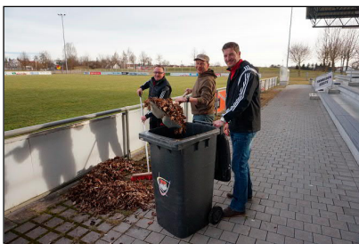
Die Führungsriege war auch dabei