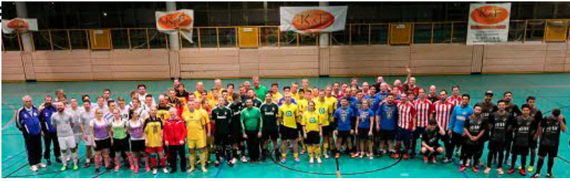
Gemeinsames Gruppenbild aller 10 Teams