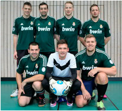
Die Junge Union zeigte sich verstärkt