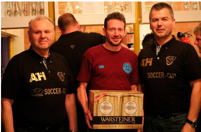
Sie würden gerne wiederkommen: Die Spieler vom Flughafen München