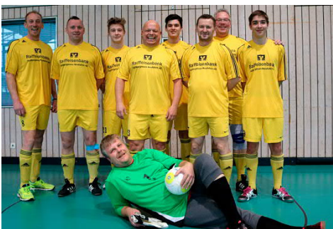
Freude über den Stockerl-Platz herrschte bei den Jugendtrainern