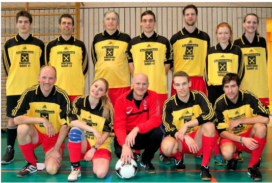
Mannschaftsbild des ökumenischen Kirchenteams mit Pfarrer