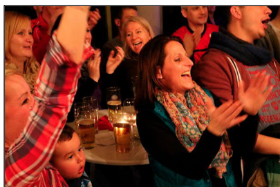
Sie machten Stimmung: Die Fans der Jugendtrainer