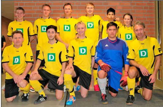
Das Vater und Sohn Team