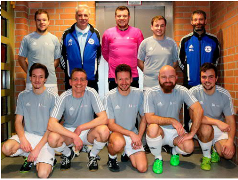
Sprangen kurzfristig ein: Das Team des Flughafens