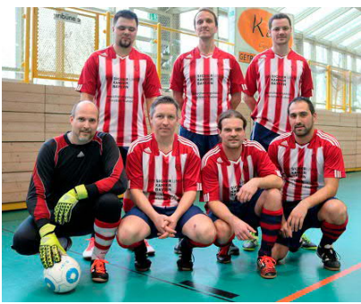
Platz 2 für die AH