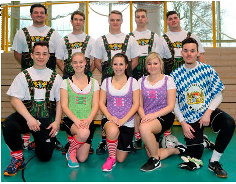
Boten nicht nur optisch einen guten Auftritt: die Narrhalla