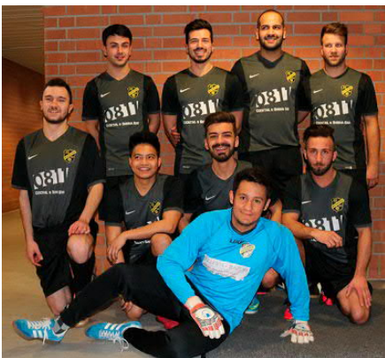
Die 0811er spielten besser als das Ergebnis vermuten läßt