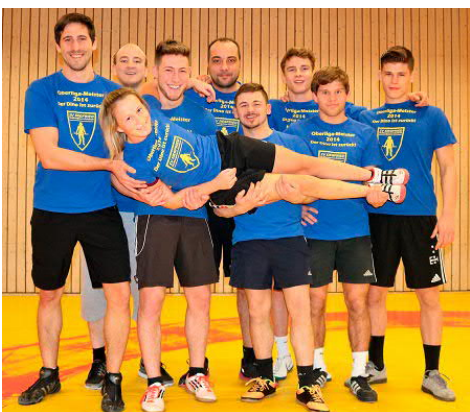
Die immer fitten Ringer