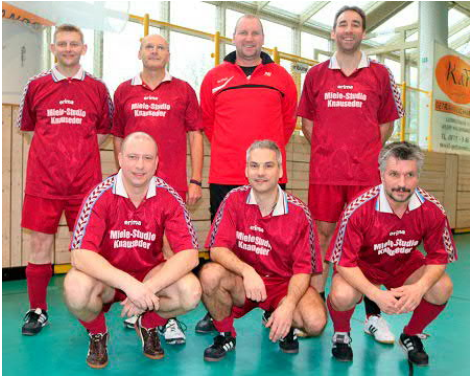
Zeigten oft fußballerische Leckerbissen: Die AH-Oldstars