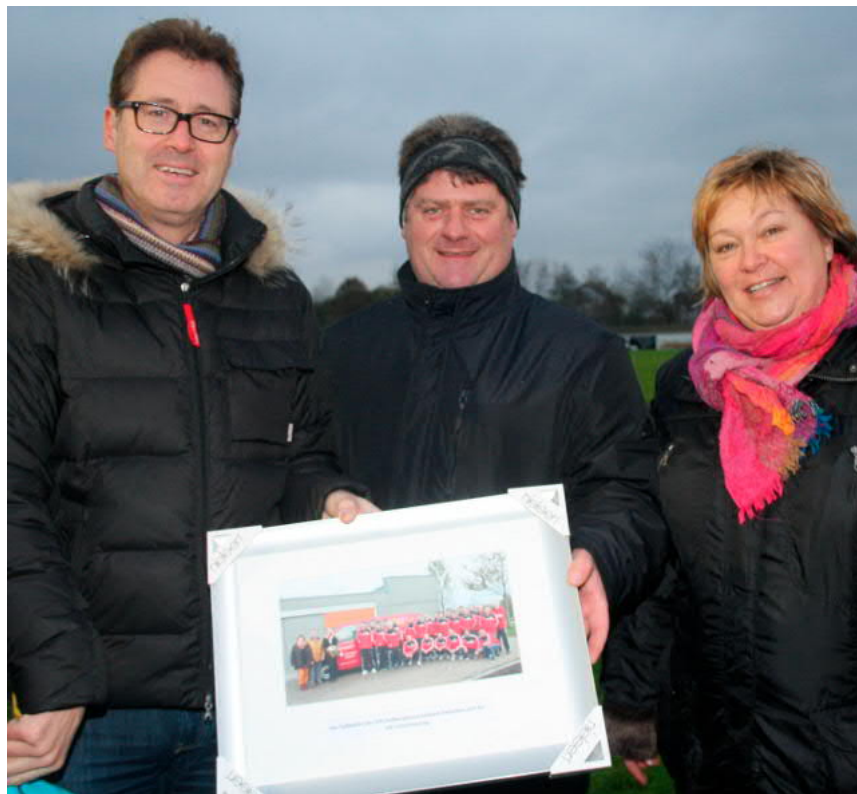
Als Dank ein Photo ein Mannschaftsbild