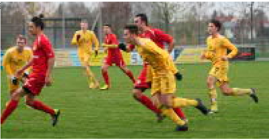
Immer dicht am Gegner zeigten sich die VfB Spieler